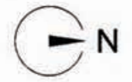
ZONIZZAZIONE SU BASE CATASTALE